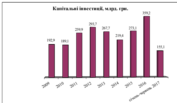
Рис. 3. Капіталі інвестиції за період 2009-2017 рр.

Обсяги освоєння капітальних інвестицій підприємств України у січні-червні 2017 року складають 155,1 млрд. грн., що на 22,5 % більше від обсягу капітальних інвестицій за відповідний період 2016 року [4].