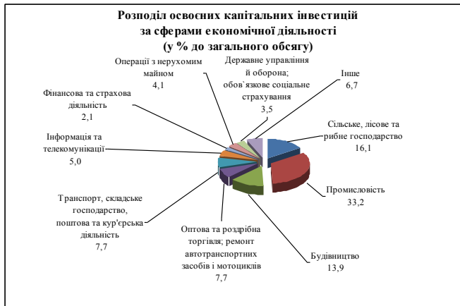
Рис. 4. Розподіл освоєних інвестицій за сферами економічної діяльності

Частка кредитів банків та інших позик у загальних обсягах капіталовкладень становила 5,2 %.