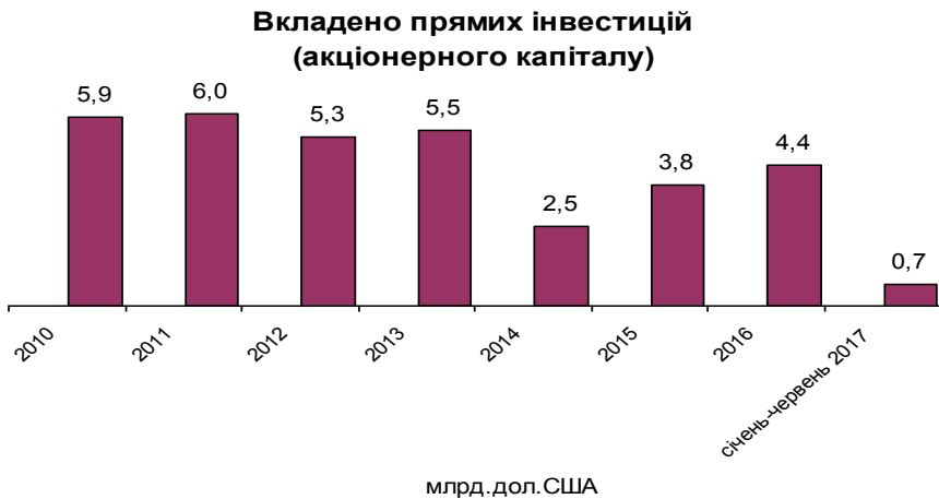
Рис. 1. Прямі інвестиції в Україні за період 2010-2017 рр.

За даними Держстату у січні-червні 2017 року в економіку України іноземними інвесторами з 75 країн світу вкладено 711,2 млн. дол. США прямих інвестицій (акціонерного капіталу) [4].