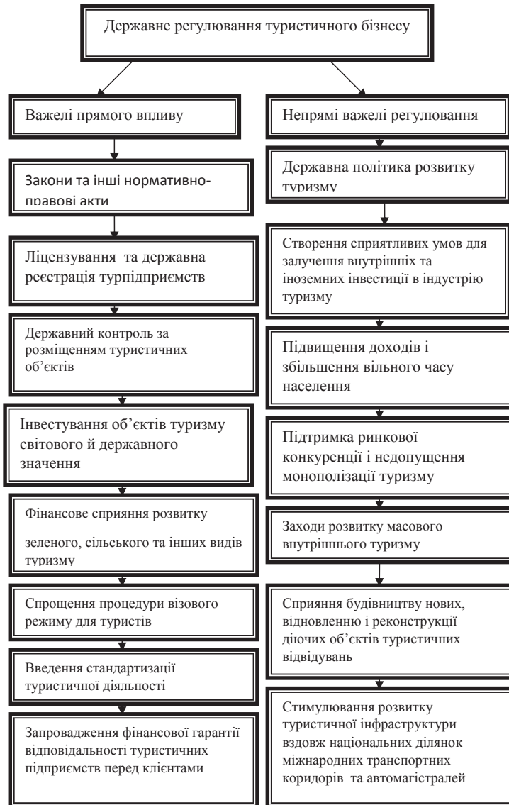
Рис. 2. Важелі державного регулювання туристичного бізнесу в Україні

– встановлення готелям, закладам харчування і курортним закладам відповідної категорії;