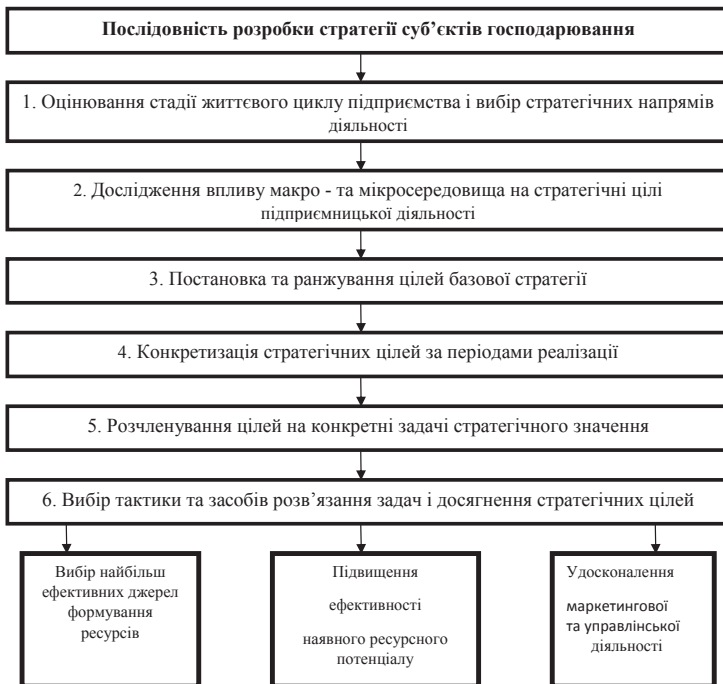
Рис. 3. Розробка загальної стратегії діяльності туристичного підприємства

Центром розробки стратегії діяльності підприємств є визначення мети та ранжування цілей.