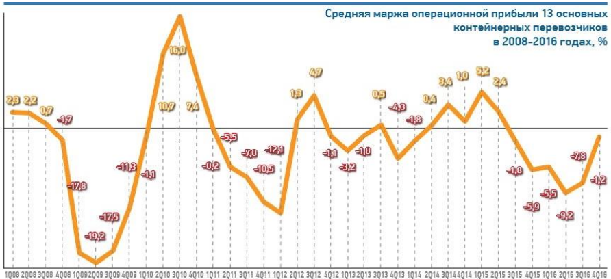
Рис. 1. Середня маржа операційного прибутку 13 основних контерейних перевізників за 2008-2016 рр., %.

передбачають продовження консолідації та й у подальшому. В наслідок через 10 років, скоріше, залишиться не більше декількох найбільших компаній. У той час як у 2014 році в галузі було два десятка ключових компаній.