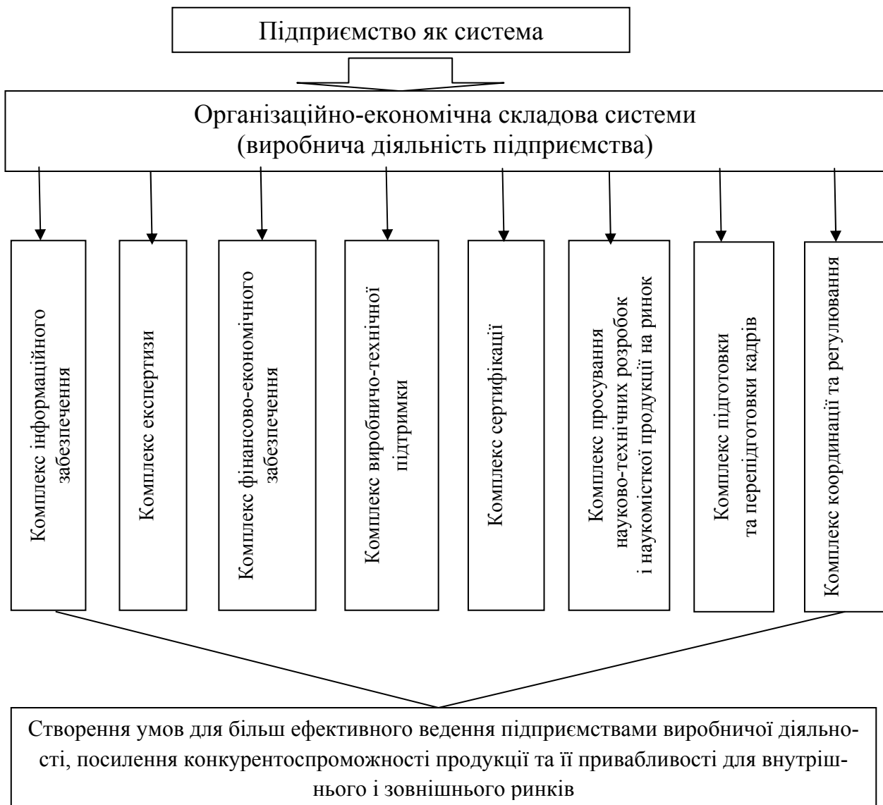
Рис. 1. Системний похід до формування і розвитку економічного потенціалу підприємства

При написанні статті використовувалися дослідження Є.В. Лапіна [6], М.М. Меркулова [7], Л.І. Федулової [8], С.В. Філіппової [9].