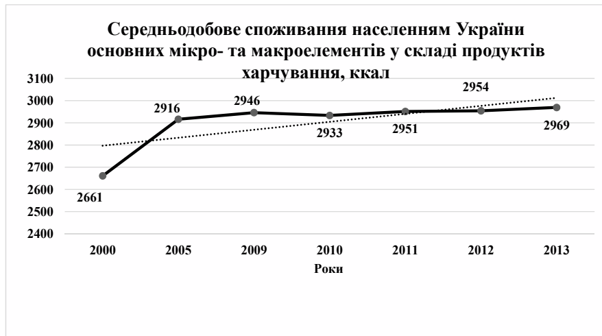
Рис.2 Середньодобове споживання населенням України основних мікро- та макроелементів у складі продуктів харчування за 2000 – 2013 рр., ккал

Простежити динаміку споживання калорій населенням України з 2000 по 2013 рр. ми можемо на рисунку 2.