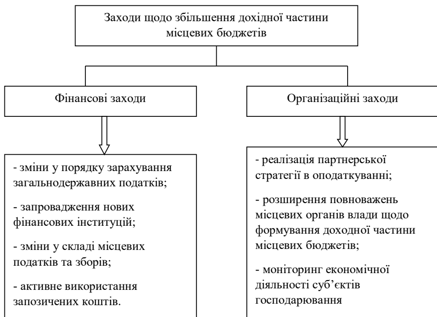
Рис. 2. Заходи щодо збільшення доходної частини місцевих бюджетів

Таким чином, покращення адміністрування ПДФО повинно передбачати, по-перше, зміну порядку зарахування податку за місцем реєстрації (проживання) платника податку. Це, на нашу думку, буде сприяти зниженню рівня диференціацію місцевих бюджетів за рівнем податкових надходжень, а по-друге, буде стимулювання економічне зростання місцевих територіальних громад шляхом збільшення податкових надходжень до місцевих бюджетів.