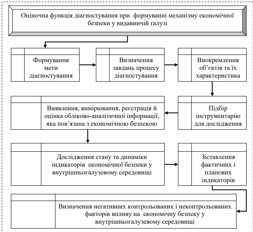
Рис 1. Етапи реалізації оціночної функції діагностування при формуванні механізму економічної безпеки у видавничій галузі

галузі та сприятиме прийняттю обґрунтованих й ефективних внутрішньогалузевих рішень щодо покращення стану економічної безпеки у внутрішньогалузевому середовищі.