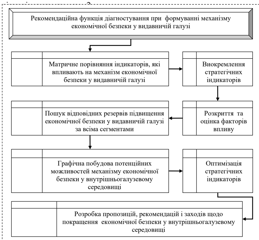
Рис 2. Етапи реалізації рекомендаційної функції діагностування при формуванні механізму економічної безпеки у видавничій галузі