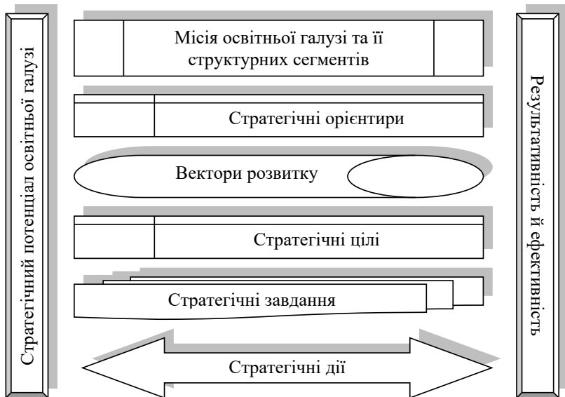
Рис. 2. Ланцюжок реалізації стратегічного потенціалу у освітній галузі