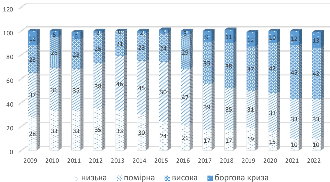
Рис. 2. Відсоткове співвідношення країн з низьким, помірним, високим і кризовим рівнем заборгованості за 2009 – 2022 рр. (%).

туацію, пов'язану із заборгованістю, або ж мають високий ризик появи зазначеної ситуації, збільшилася до 60 %, що вдвічі більше, ніж було зафіксовано у 2015 році (рис. 2)