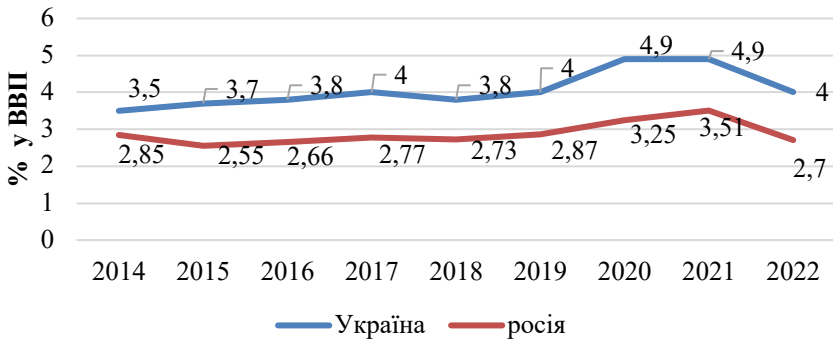
Рис. 2. Частка інформаційних технологій у структурі ВВП України та РФ протягом 2014-2022 рр.

Отже, в цілому ефективність протидії ризикам і загрозам економічній безпеці України у цифровій сфері в умовах війни є високою. Цьому сприяла швидка цифрова трансформація національної економіки та реалізація резервів цифровізації. Частка інформаційних технологій у 2014 році складала 3,5% у структурі ВВП України, а у період коронакризи вона зросла до 4,9% у 2020 році. При цьому офіційний показник є заниженим, адже у сегменті інформаційних технологій висока частка тіньової економіки. У російському секторі ІТ ситуація дещо гірша внаслідок санкцій, зокрема технологічних, та активній імміграції спеціалістів. Так, починаючи з 2014 року російський ринок ІТ-послуг значно скоротився й частка інформаційних технологій у ВВП РФ у 2022 році становила 2,7% проти 4% в Україні (рис. 2).