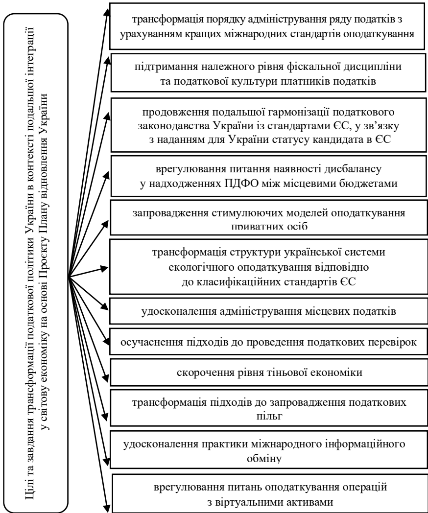
Рис. 3. Цілі та завдання трансформації податкової політики України в контексті подальшої інтеграції у світову економіку на основі Проєкту Плану відновлення України