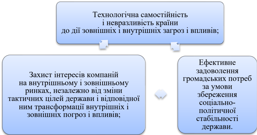
Рис. 1. Основні складові міжнародної економічної безпеки країн

Класифікувати особливості міжнародної економічної безпеки, за результатом сукупності глобальних трансформацій як всередині країни, так і цілому у світовому господарстві, можна представити як систему чинників і процесів що наведені на рисунку 2.