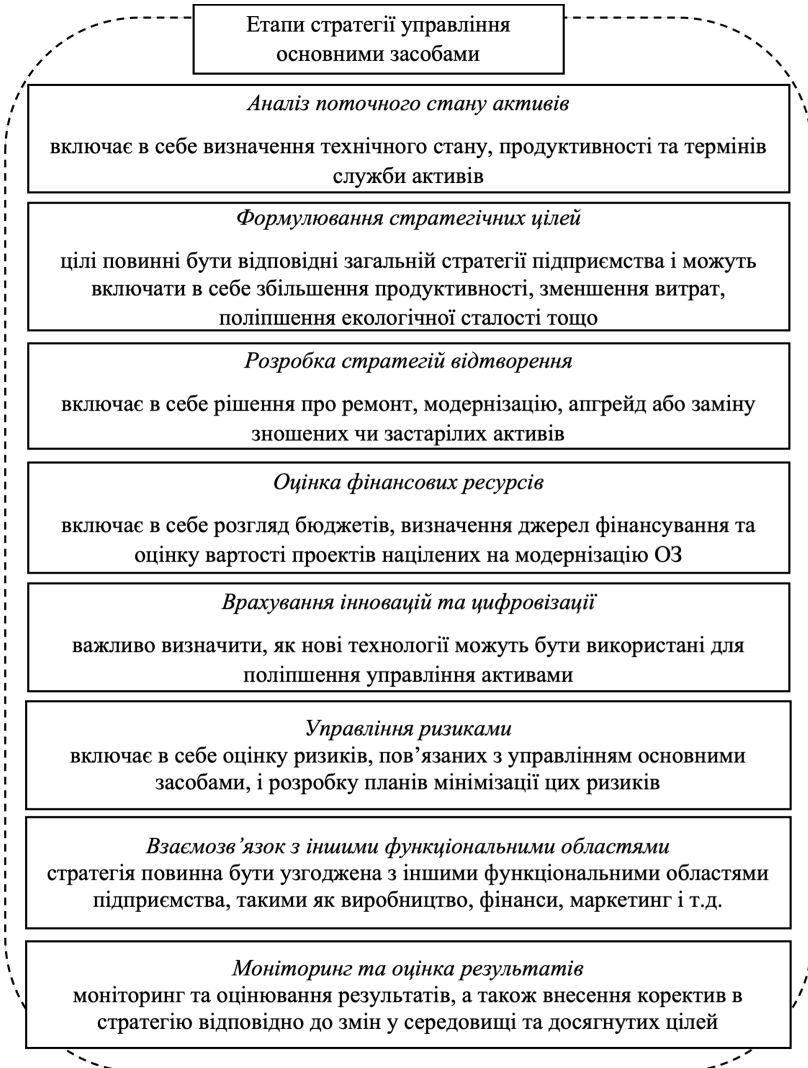
Рис. 3. Особливості формування стратегії управління основними засобами.

ному динамічному економічному середовищі вимагає комплексного та системного підходу.