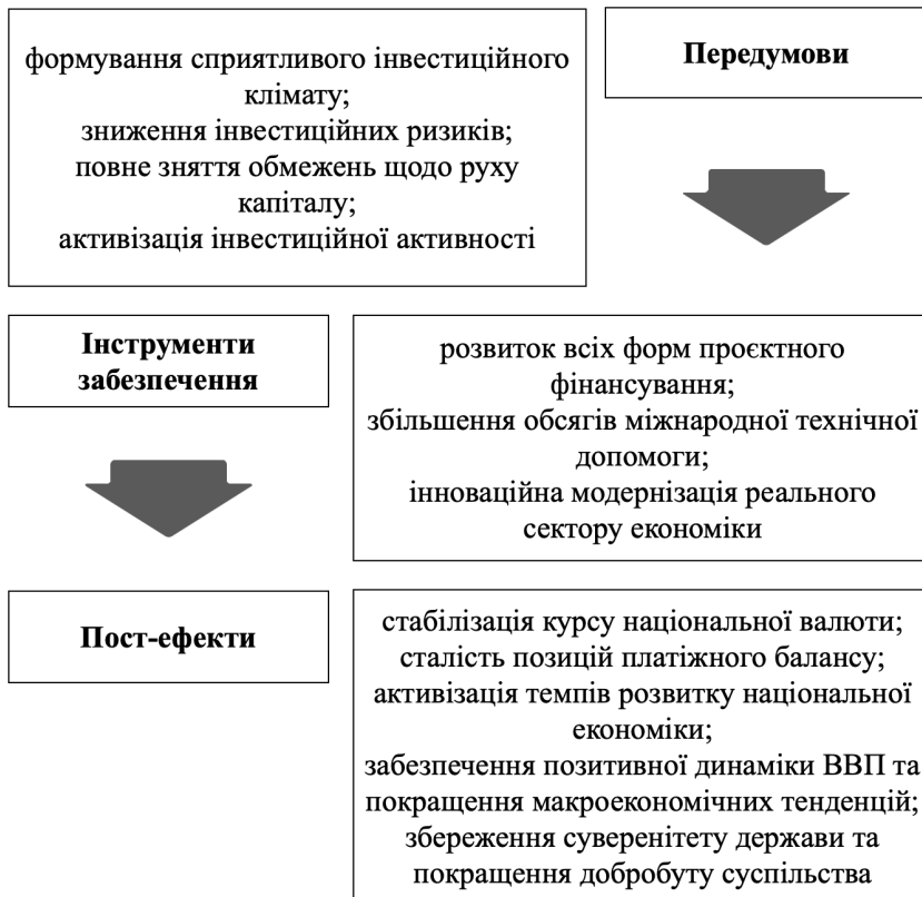
Рис. 1. Структурно-логічна схема використання інструментарію проектного фінансування в системі забезпечення соціально-економічної та фінансової безпеки держави.

З огляду на доцільність використання проектного фінансування в контексті розвитку інвестиційного середовища, вважаємо за необхідне застосувати концептуальні підходи до з'ясування місця інструментарію проектного фінансування в рамках забезпечення національної соціально-економічної та фінансової безпеки держави (рис. 1).