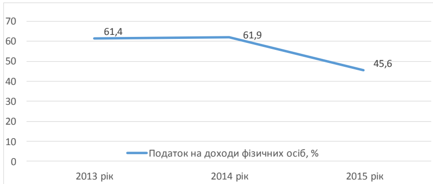
Рис. 2. Частка податку на доходи фізичних осіб в структурі місцевих бюджетів, % [7]

податок на доходи фізичних осіб, попри переспрямування його значної частини до державного бюджету (рис. 3) [6, с. 247].