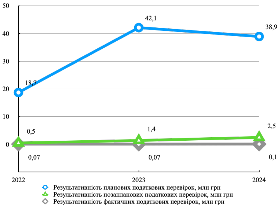
Рис. 2. Динаміка обсягів донарахувань на одну перевірку за видами перевірок органами Державної податкової служби України.

Для поглибленого розуміння ефективності податкового контролю важливо проаналізувати результативність окремих видів податкових перевірок (рис. 2).